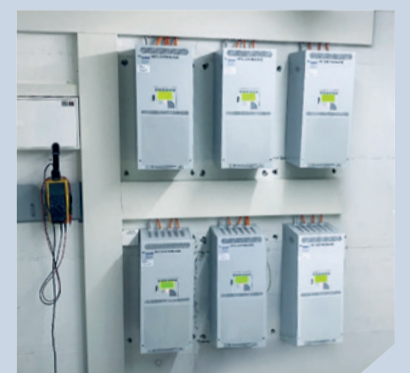
Vorher – nachher: Gefängnis Dielsdorf

Lassen auch Sie demnächst Ihre Installationen von unseren ALMAT-Service-Spezialisten begutachten.