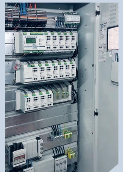
Vorher – nachher: Schauspielhaus Zürich