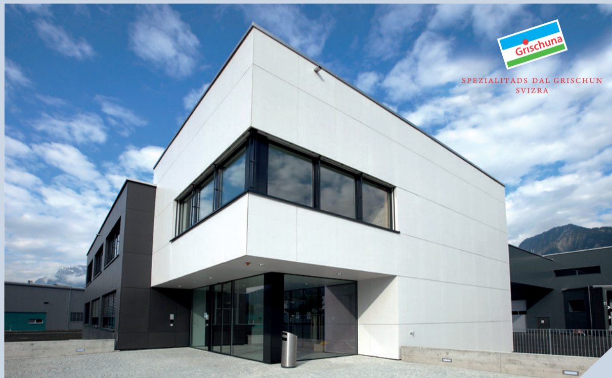
Fleischrocknerei Churwalden AG in Landquart: Das «Minipic»-Unternehmen setzt auf die hohe Sicherheit der ALMAT-Anlagen.

Spätestens seit dem Beinahe-Strom-Blackout in den Wintermonaten 21/22 haben Notstromlösungen an Relevanz und Aufmerksamkeit gewonnen. Das Thema Stromausfall ist nicht neu: Bereits im Januar 2017 führte SRF den Thementag «Blackout» 1 durch, und im Juni 2021 wies die Eidgenössische Elektrizitätskommission ElCom 2 an ihrer Jahresmedienkonferenz auf mögliche Defizite in den Wintermonaten hin.